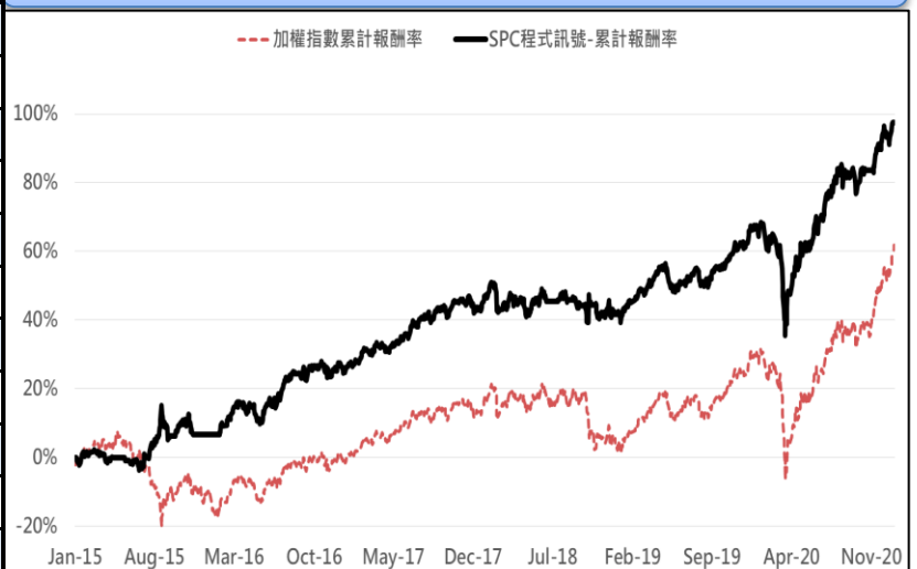
策略回測與近月台指期貨累計報酬率(%)