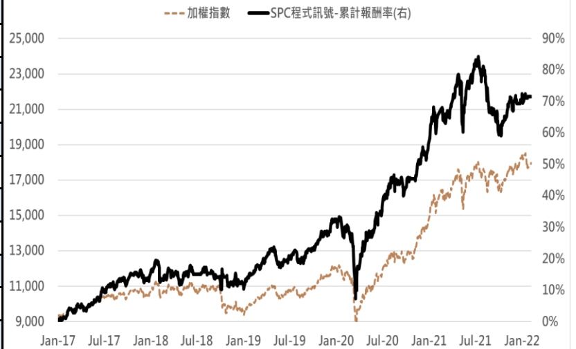
策略模擬交易回測與近月台指期貨累計報酬率(%)